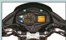
کیلومتر آنالوگ / دیجیتال