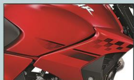
بدنه ی آئرو دینامیک